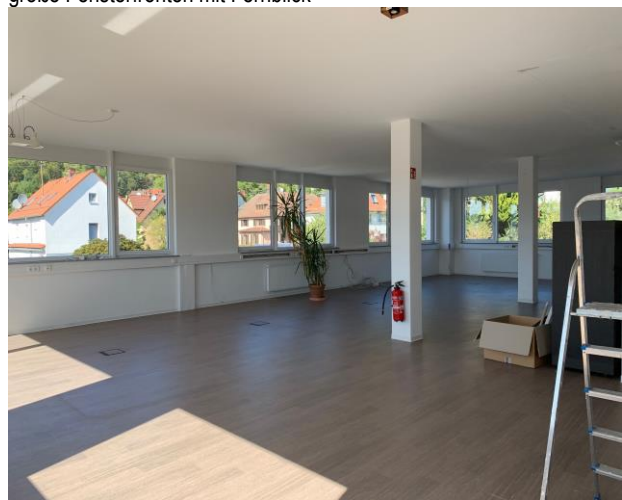
Grundriss nach Bedarf variabel