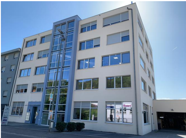
Straßenansicht der gepflegten Gewerbeimmobilie