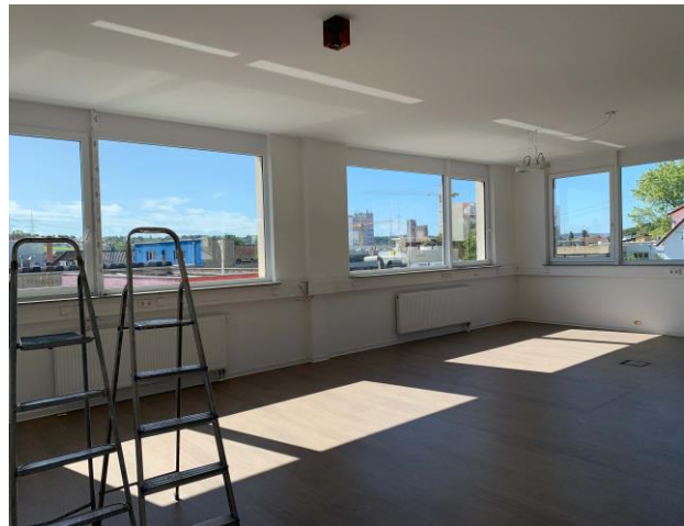
große Fensterfronten mit Fernblick